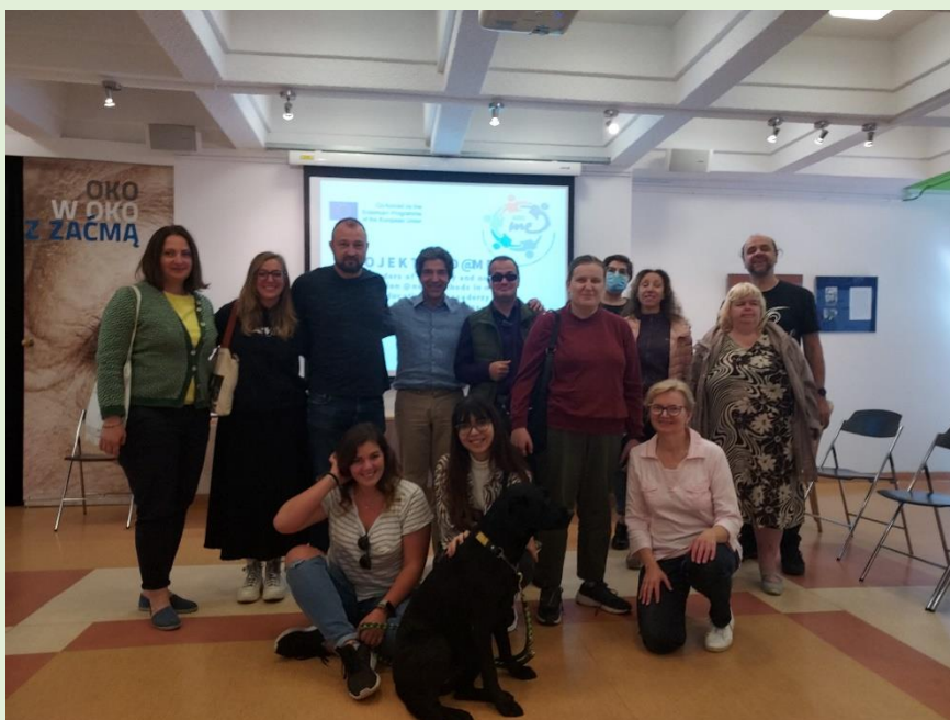
Zdjęcie 2. Przedstawiciele i osoby do kontaktu w ramach projektu ADD@ME w działaniu! Działania podczas szkolenia dla kadry projektu w Warszawie