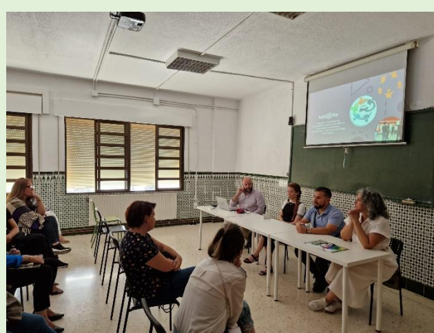
Figura 7: Eveniment multiplicator în Spania