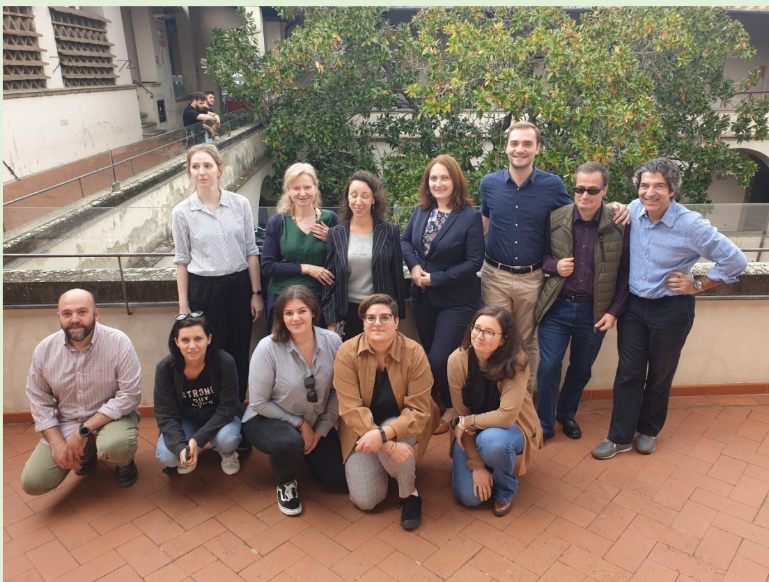
Figura 1: Membrii consorțiului ADD@ME în timpul celei de-a treia întâlnire transnațională în Florența.

Cea de-a patra și ultima întâlnire transnațională a proiectului a avut loc la Florența. Reuniunea a fost găzduită de Unione Italiana Ciechi ed Ipovedenti Sezione Provinciale di Firenze, coordonatorul proiectului. Reprezentanții tuturor organizațiilor partenere au participat la întâlnire, au reflectat asupra a ceea ce s-a realizat (de exemplu, ghidul multilingv pentru ADD@ME ONLINE TRIVIAL GAME FOR VI AMBASSADORS) și au luat decizii pentru ultimele evenimente locale de multiplicare.