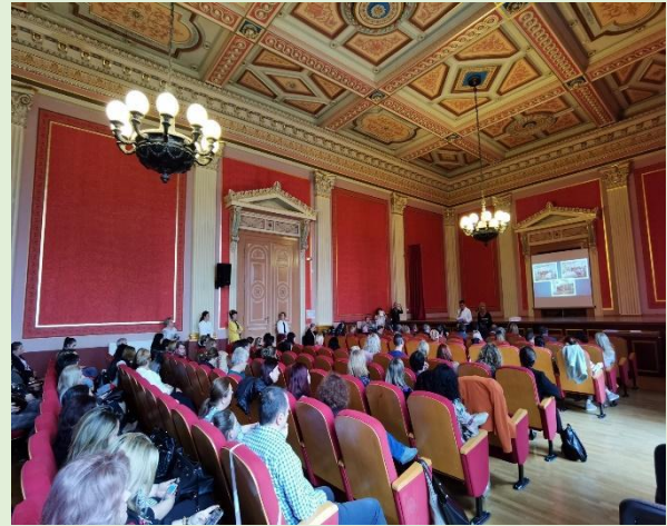
Figura 4: Eveniment multiplicator în România