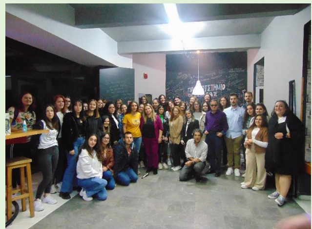
Figure 6: Workshopuri în Greciaâ