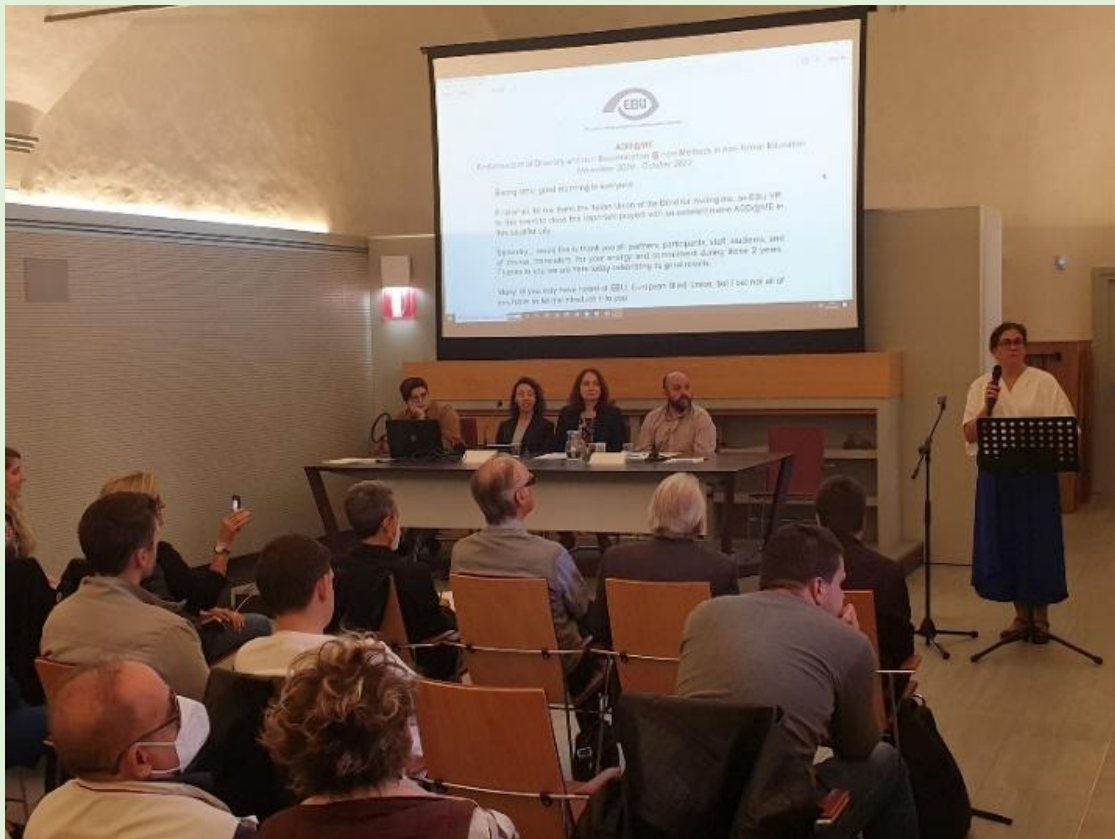
Figura 2: Conferința finală în Florența, Italia