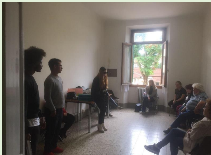
Figura 3: Workshopuri în Italia